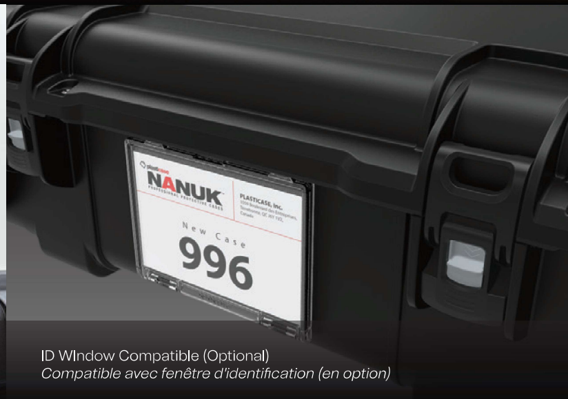
ID Window Compatible (Optional) Compatible avec fenêtre d'identification (en option)