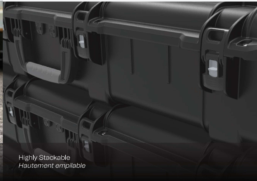
Highly Stackable Hautement empilable