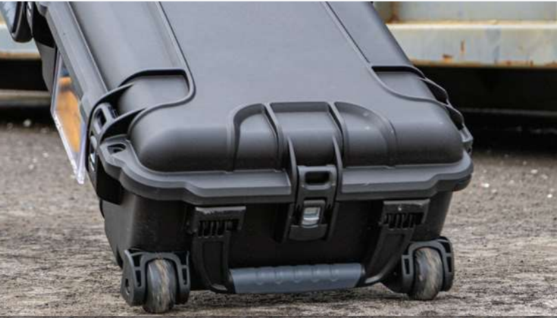
2 Large and Strong Polyurethane Wheels 2 grandes et solides roues en polyuréthane