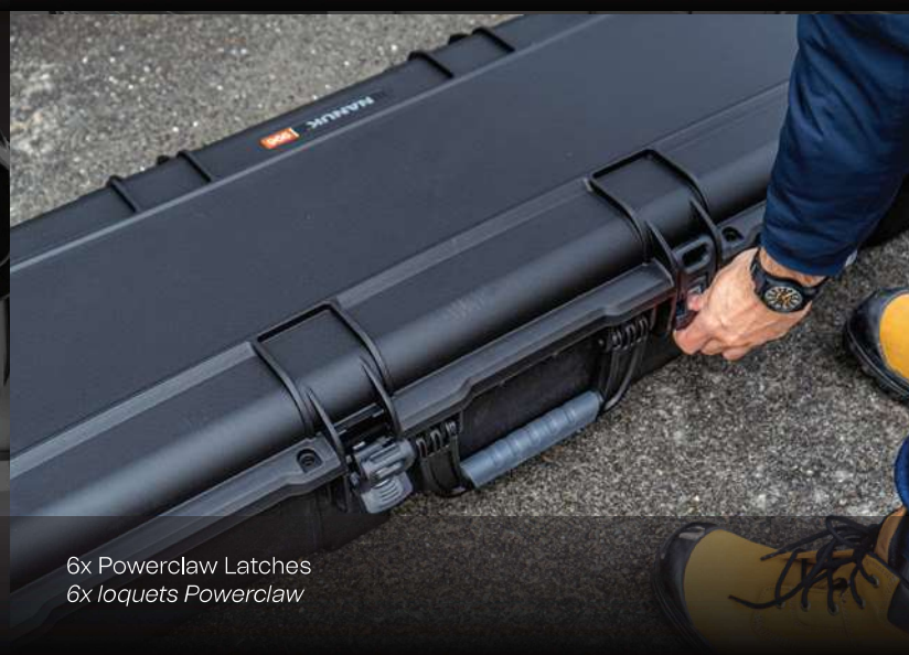
6x Powerclaw Latches 6x loquets Powerclaw