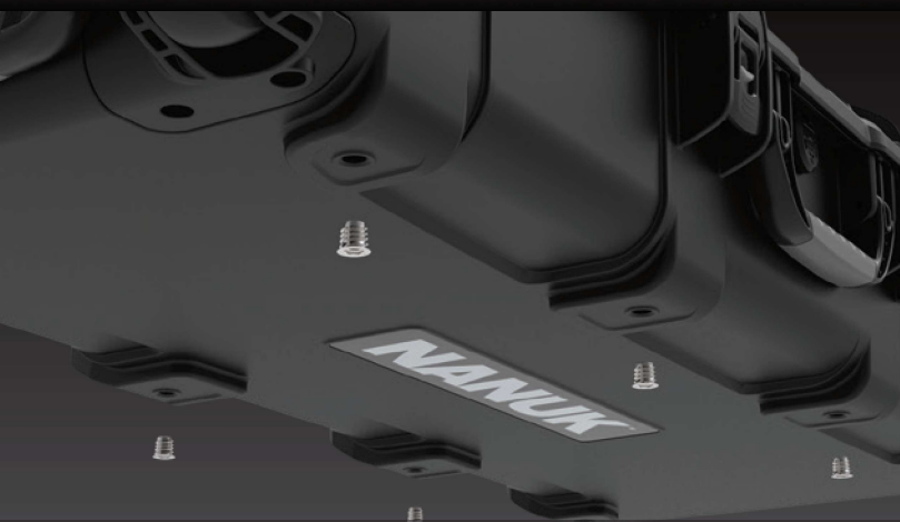
8x M8 Threaded Steel Inserts 8x inserts filetés en acier M8